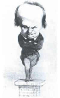
Victor Hugo par Honoré Daumier, 1849